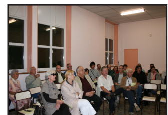
Lunéville, 15 septembre 2009