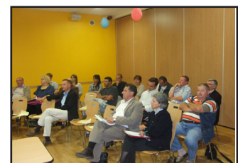
Badonviller, 9 septembre 2009