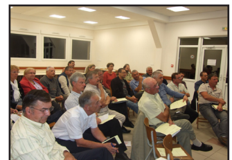
Donjevin, 8 septembre 2009

Le manque de garde d'enfants sur certains territoires est un handicap pour attirer des jeunes ménages.