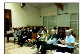
Einvaux, 16 septembre 2009