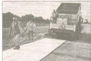
Les ouvriers posent une toile antissuages avant que ne soit déposée la couche de liaison et l'enrobé.