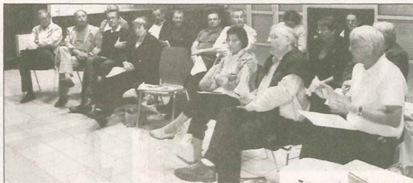
L'habitat, le transport, les loisirs des jeunes ont été évoqués.