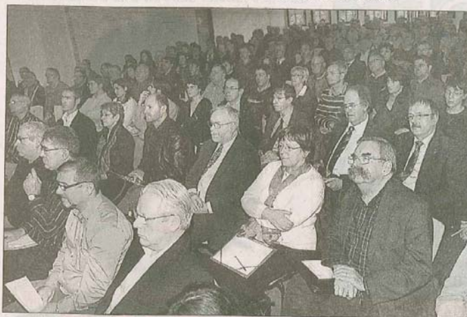
Le centre de gestion de Villers avait fait le plein pour cette conférence générale.

Avant de mettre en débat plusieurs problématiques : interdépendance, valorisation économique, stratégie spatiale et organisation du