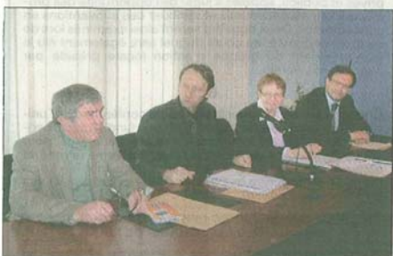
La réunion des maires s'est tenue à Mont-sur-Meurthe.