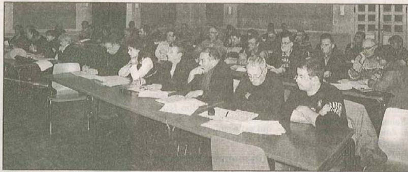
Les élus communautaires réunis à Azerailles.

A l'ordre du jour figuraient également les indemnités de fonction du président et des vice-présidents, le maintien des avantages acquis et la création d'un emploi d'attaché à détacher dans les fonctions de directeur général des services. En ce qui concerne les indemnités de fonction, par 34 voix pour, 3 abstentions et 16 contre, il a été décidé alors que le taux maximal autorisé soit un pourcentage rapporté à l'indice brut (soit 3.782,46 €) de la fonction publique (48,75 % pour le président et 20,63 % pour chaque vice-président), que ces derniers ne percevaient que 75 % du taux plein de celles-ci. Quant aux avantages acquis, ils concernaient plus précisément le versement du 13 e mois pour l'ensemble du personnel permanent de la CCVC, qu'il soit issu de la commune de Baccarat, de la CCC ou de la CCEMV y compris le ou les agents permanents à recruter par la communauté de communes des Vallées du Cristal.